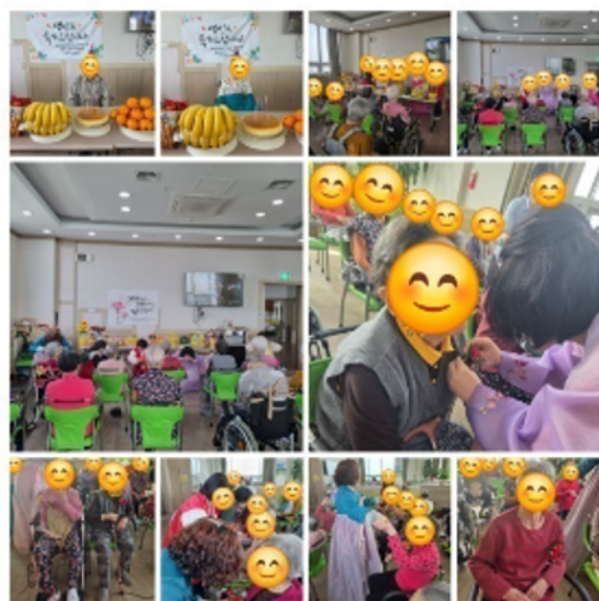
어버이날 행사 & 생신잔치